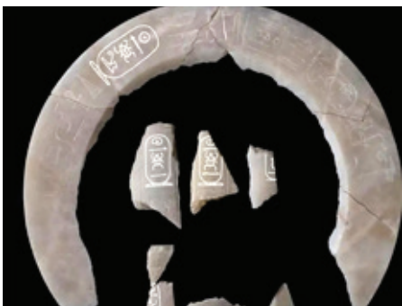
EGIPTOKO ANTZINAROKO MINISTERIOA

baina faraoien hilobi ukitugabeak aurkitzea oso zaila da. Jakina, faraoienak ziren aberastasun gehien gordetzen zituzten hilobiak eta, horregatik, gehienak aspaldi harpilatu zituzten. Ukitu gabe aurkitutako azken hilobia Tutankamonena izan zen (1922) eta horregatik azken mendeko aurkikuntza garrantzitsuenetakoa dela diote titularrek. ●