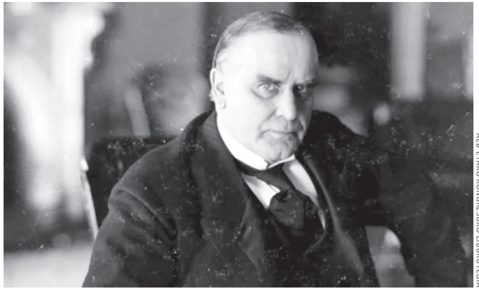
William McKinley, AEBetako 25. presidentea.

Baina McKinley beste modu batzuetara ere omendu nahi du Trumpek: haren urratsei jarraituta. McKinleyri "protektionismoaren Napoleon" esaten omen zioten inportazioei muga-zerga zorrotzak jartzea bultzatu zuelako, eta horrek oparotasuna ekarri zion herrialdeari, Trumpen ustez. Baina Trumpek esaten ez duena da neurri horiek ez zirela denek gustuko izan, eta nekazariak gogor kritikatu zituzten bere garaian enpresa handien mesedetan eta euren kaltetan jokatu izana. Gainera, McKinleyk nagusiki Ohioko kongresista zela bultzatu zituen neurri horiek; presidentetzan jarrera aldatu zuen, "merkataritza gatazkak ez dira errentagarriak" esan eta negoziazioaren bidea hobetsi zuen.